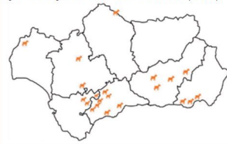
Figura 1. Amaltea: ganaderías de orientación láctea monitorizadas (año 2018).

► A través del proyecto Amaltea, se ha integrado en una Plataforma de Gestión Web-App el conocimiento acumulado a través de los programas de Cabran- daluca y de la Universidad de Sevilla, para que los ganaderos tengan acceso a todos sus datos en tiempo real, tanto a nivel de App como en Web, constituyendo la herramienta más innovadora del sector