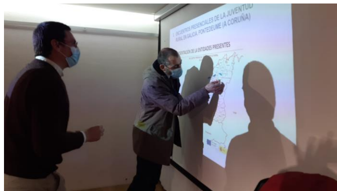
Foto 2. Presentación de las entidades y ámbito de actuación.

Posteriormente, se realizó una presentación de las asociaciones y entidades presentes, los proyectos que están realizando y los territorios sobre los que trabajan.