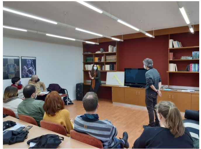
Foto 2: Presentación de los proyectos de su entidad por parte de una de las participantes al encuentro.

En la exposición de los proyectos de las asociaciones y de las entidades presentes, cada participante presentó brevemente el trabajo que llevan a cabo en sus diferentes ámbitos territoriales de actuación, que van desde lo local a lo regional.