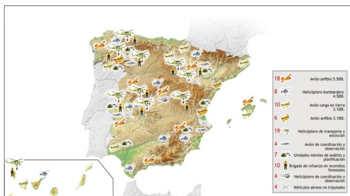
Medios del MAPA en la Campaña 2019. 37 bases en total

El MAPA dispone de medios durante todo el año para dar cobertura nacional a la extinción de incendios, principalmente aeronaves, que pueden ser movilizados a cualquier punto del territorio donde sean necesarios para cubrir las solicitudes de apoyo de las comunidades autónomas. Los meses con más riesgo de incendios forestales se refuerzan los dispositivos con más aeronaves, Brigadas helitransportadas de refuerzo (BRIF) , Unidades Móviles de Meteorología y Transmisiones (UMMT) y Aeronaves de Comunicaciones y Observación (ACO) . Se pueden consultar los medios disponibles para la campana de verano y para la campana de invierno , así como todos los medios desplegados en todo el territorio nacional.